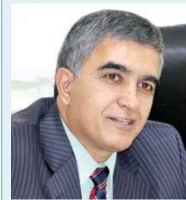
Шавкат ҲАМРОЕВ, Ўзбекистон Республикаси сув хўжалиги вазири:

Шу пайтгача энг катта муаммоларимиздан бири — мелiorация эди. Бу ортиқча энг катта муаммоларимиздан бири — мелiorация эди. Бу ортиқча энг катта муаммоларимиздан бири — мелiorация эди. Бу ортиқча энг катта муаммоларимиздан бири — мелiorация эди.