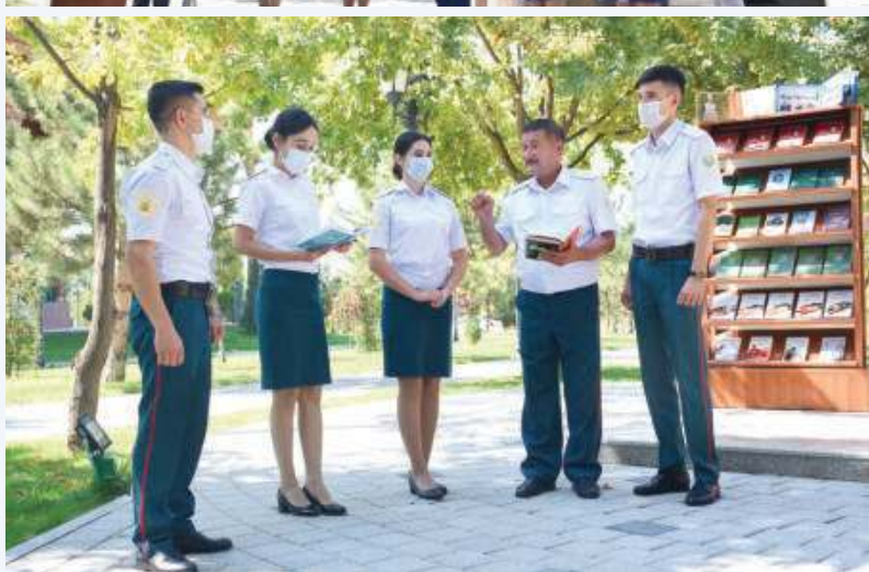
Хизми йўлдошлар билан суҳбатлар.