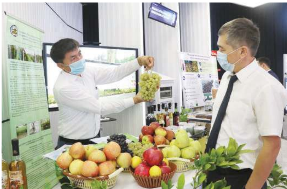
бўлган, синов ишлари якунланиб, ишлаб чиқаришга тайёр лойиҳаларни билан қатнашди.

Ҳақиқатан, бугун мамлакатимизда илм-фан ва ишлаб чиқаришни интеграциялаш давлат сиёсатининг устувор йўналишларидан бирига айланди. Турли ташкилотлар кўмагида истиқболли ғояларни амалга оширишни молиялаштириш, олимлар ва ишлаб чиқарувчиларни ўзаро боғлаш орқали узоқ йиллар давомида қўлғам ҳолида сақланаётган, молиявий муаммолар туфайли амалиётга киритилган қўллаб-қўллаш лойиҳаларни реал технологияларга айлантириш жаддалашди. Кўргазмада 32 дан ортиқ илмий ташкилот ўзларининг қишлоқ хўжалигида фойдали