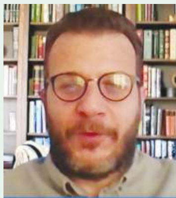
Бридждж ДЖИДЖАН, Халқаро қишлоқ хўжалигини ривожлантириш жамғармаси — IFADнинг Яқин Шарқ, Шимолӣ Африка ва Европа мамлакатлари бўйича департаменти директори:

— “Қишлоқ хўжалигини диверсификация ва модернизация қилиш” лойиҳасини амалга ошириш Ўзбекистон билан ҳамкорлигимизнинг янги босқичидир. Биз бундан деярли етти йил олдин кичикроқ миқёсда иш бошлаган эдик. Ҳозирги кунда эса IFADнинг Ўзбекистонда катта сармоялари бор. Ушбу лойиҳа Фарғона водийси учун мўлжалланган бўлиб, ҳукуматнинг қишлоқ хўжалиги секторини қўллаб-қувватлаш, фермерларнинг инфратузилма ва молиялаштириш имкониятларини яхшилашга қаратилган. Умид қиламанки, ушбу лойиҳа IFAD ва Ўзбекистон ҳукуматининг ислохотлар дастурини қўллаб-қувватлаш борасида янги ва кенг-роқ ҳамкорлик ашикларини очади.