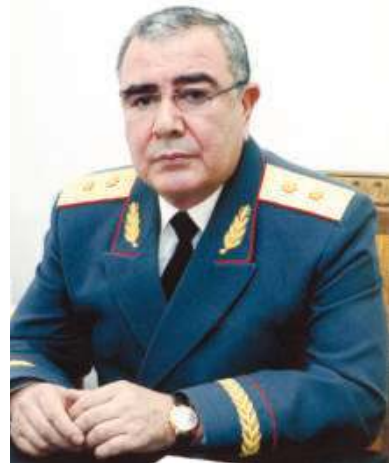
Баҳодир МАТЛЮБОВ, Ўзбекистон Республикаси ИИВ академияси бошлиғи, генерал-лейтенант

Ўзбекистон Республикаси ИИВ академияси жамоаси Чўлпон меросини янги тафаккур асосида тадқиқ этиш ва ўрганишга киришди. Бу борада белгиланган "йўл харитаси"га мувофиқ, дастлаб Чўлпон ҳаёти ва ижодини ўрганиш учун Андижон ва Наманган вилоятларига академия олимларидан иборат илмий экспедиция