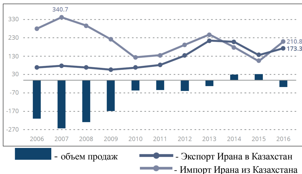
Рис.3. Объем экспорта и импорта Ирана из Казахстана (2006-2016 гг.)

Приведенные выше цифры аналогичны данным, предоставленным другими иранскими властями, с отклонениями в данных (около 2-3% за некоторые годы) из-за округления и ошибок при преобразовании григорианского календаря в иранский календарь. Такая же информация фигурирует в отчетах Торгово-промышленной палаты Ирана за 2013 год.