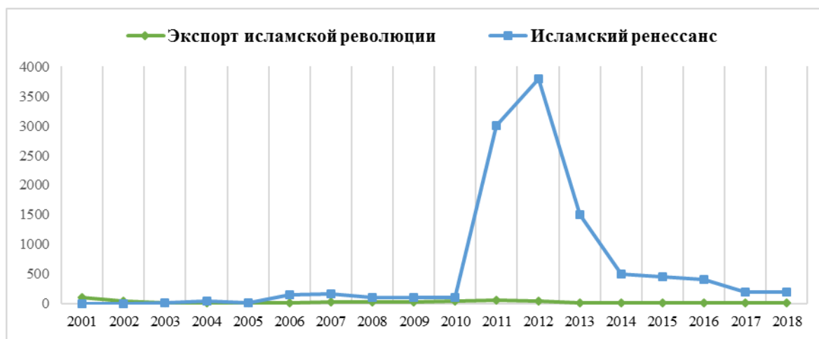
Рис.1. Упоминание фраз «Экспорт исламской революции» и «Исламский ренессанс» в иранских политических кругах с 2000 по 2018 год 10 .

От западных исследователей П. Мохсени 8 и С. Хадери 9 , в которых авторы всесторонне проанализировали концепцию «исламского возрождения» в контексте внешней политики Ирана. Тем не менее актуальность и общественно-политическая значимость изучения проблемы подтверждаются новыми тенденциями современной иранской внешней политики, данными статистических исследований, например, информацией информационного агентства ИСНА (ISNA) (рис. 1).