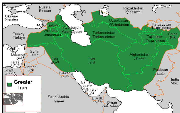
2-rasm. Arablar tomonidan aks ettirilgan “Katta Eron” hududlari 12

XIX asrdan to hozirgacha eronshunoslikda “Katta Eron” va “Eron” atamallari qo‘llanib keladi. Shuningdek “Buyuk Eron” va “Eron madaniy o‘lkasi” kabi atamalar ham uchrab turadi. “Katta Eron” o‘lkasi hozirgi siyosiy jabhadan tubdan farq qilib, faqat tarixiy, madaniy va diniy birlikka ishora qiladi. Keyinchalik eronliklar yashaydigan chegaralar va hududlarda ko‘plab o‘zgarishlar ro‘y berdi, lekin Katta Eronning ko‘p qismlarida til va madaniyat hukmron vosita bo‘lib qoldi.